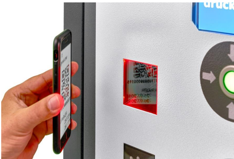
Bild 4: Bei modernen Lösungen können Schranken auch mit einem QR-Code auf dem Smartphone bedient werden. Dabei wird das Smartphone berührungslos vor den Leser am Kontrollgerät gehalten.

Bild 3: Der Fahrer kann sich durch Codeeingabe, Fingerabdruck, einen QR- beziehungsweise Barcode oder eine RFID-Transponderkarten legitimieren.